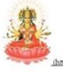
http://anjanred.files.wordpress.com/2011/08/gayatri_rvmantram1.png gayatri mantram in telugu with meaning

“ఓం దూర్భవస్సువః – తతన్విరుర్య రణ్యం తథేదవస్య ధీమహి – ధీయా యానః సువదయాతః!”